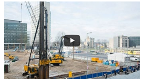
Damwand drukken en voorbereiden Parkeergarage Jaarbeursplein Utrecht