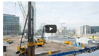
Damwand drukken en voorbereiden Parkeergarage Jaarbeursplein Utrecht