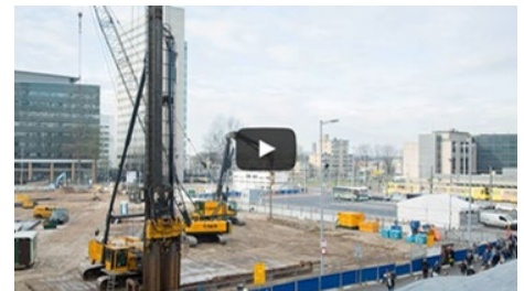
Damwand drukken en voorbereiden Parkeergarage Jaarbeursplein Utrecht