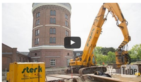
Bodemsanering Dunea Pompstation